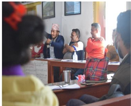
PFA and self care training to the health workers

Kitchen Gardening and Off seasonal vegetable farming Training to farmer group at Bhume