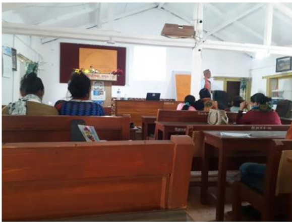
Social Audit training to the key stakeholders