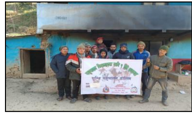
ख) भूमे २ खावाशड