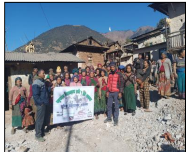
ड) भूमे ३ क्याडसी