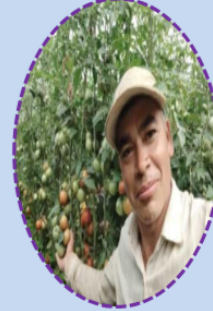
बल बहादुर चलाउने

“ब्यवसायिक तरकारी उत्पादनमा जोडिएर काम गर्दा राम्रै आम्दानी हुने स्थिति देखेर एकवर्षपछि सोलनबाट घरमा गइ श्रीमतीलाई पनि साथमै लिएर सोलनमा आई दम्पती नै ब्यवसायिक तरकारी उत्पादनमा लागेको।”